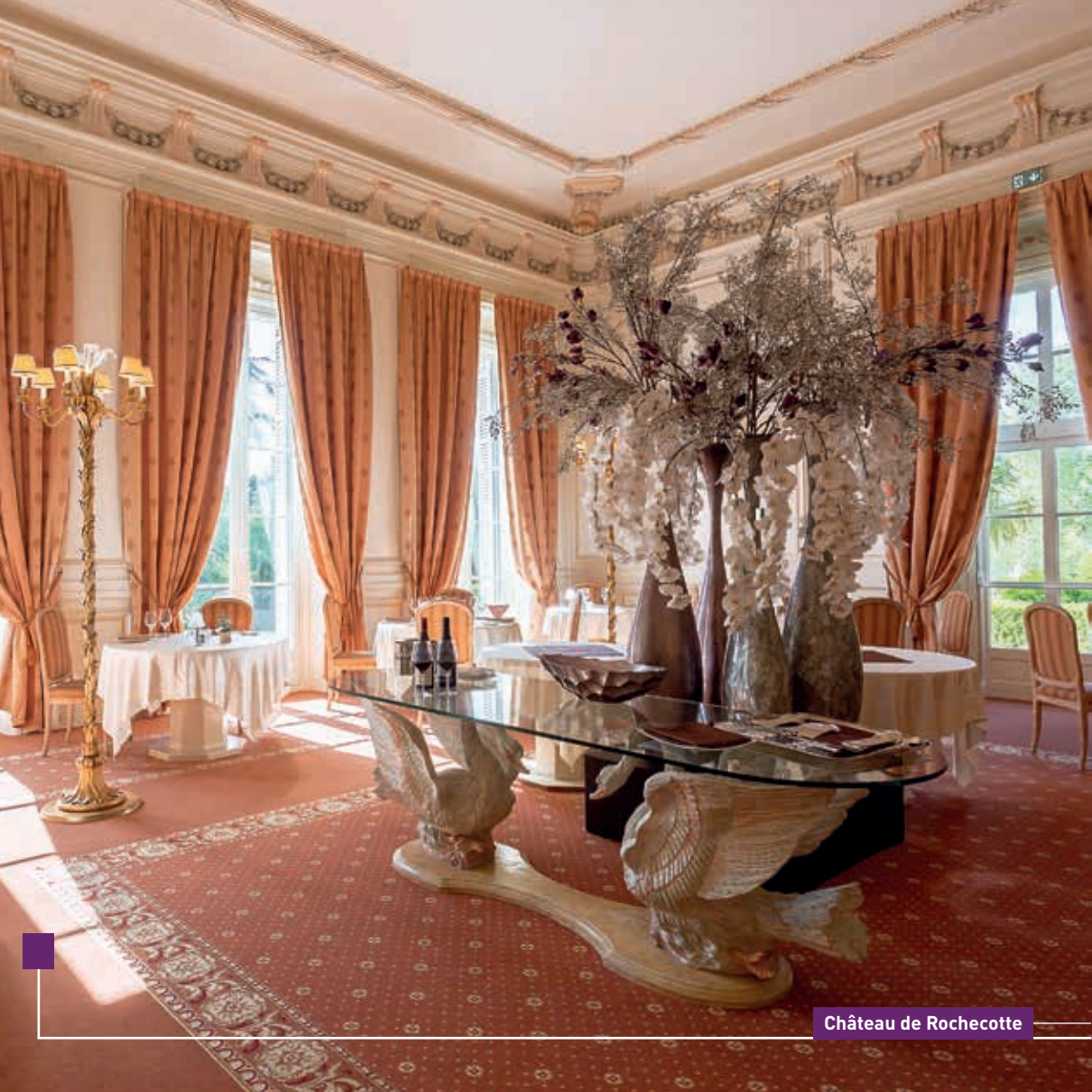
Château de Rochecotte