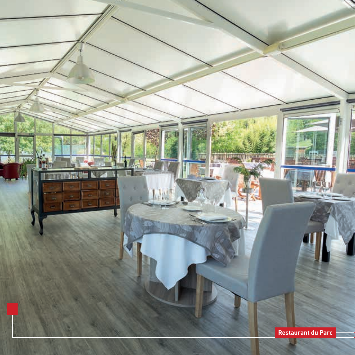
Restaurant du Parc