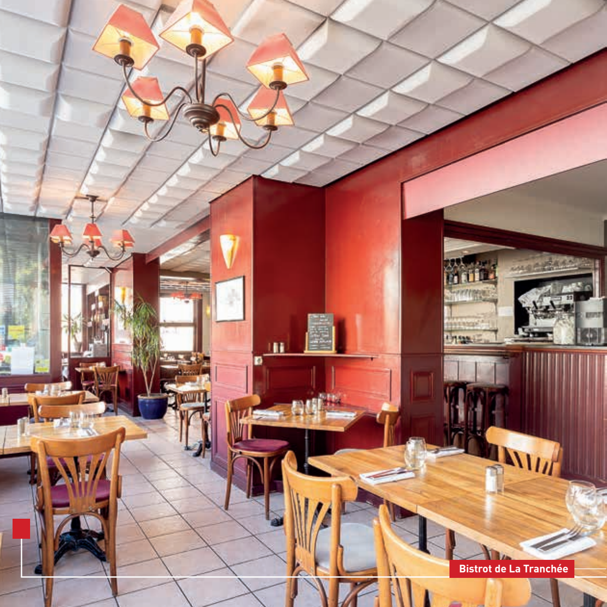
Bistrot de La Tranchée