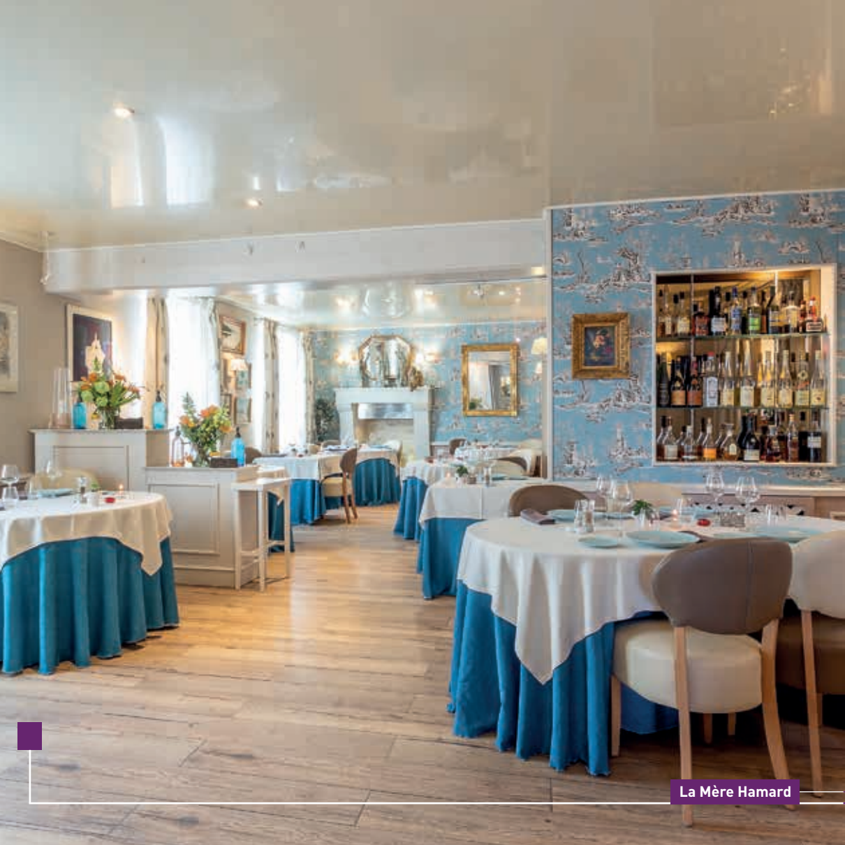
La Mère Hamard