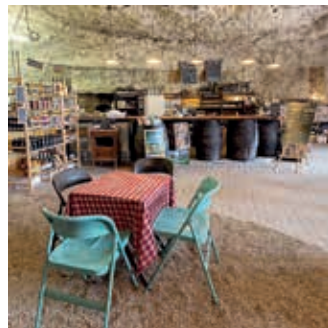
Bar à vin