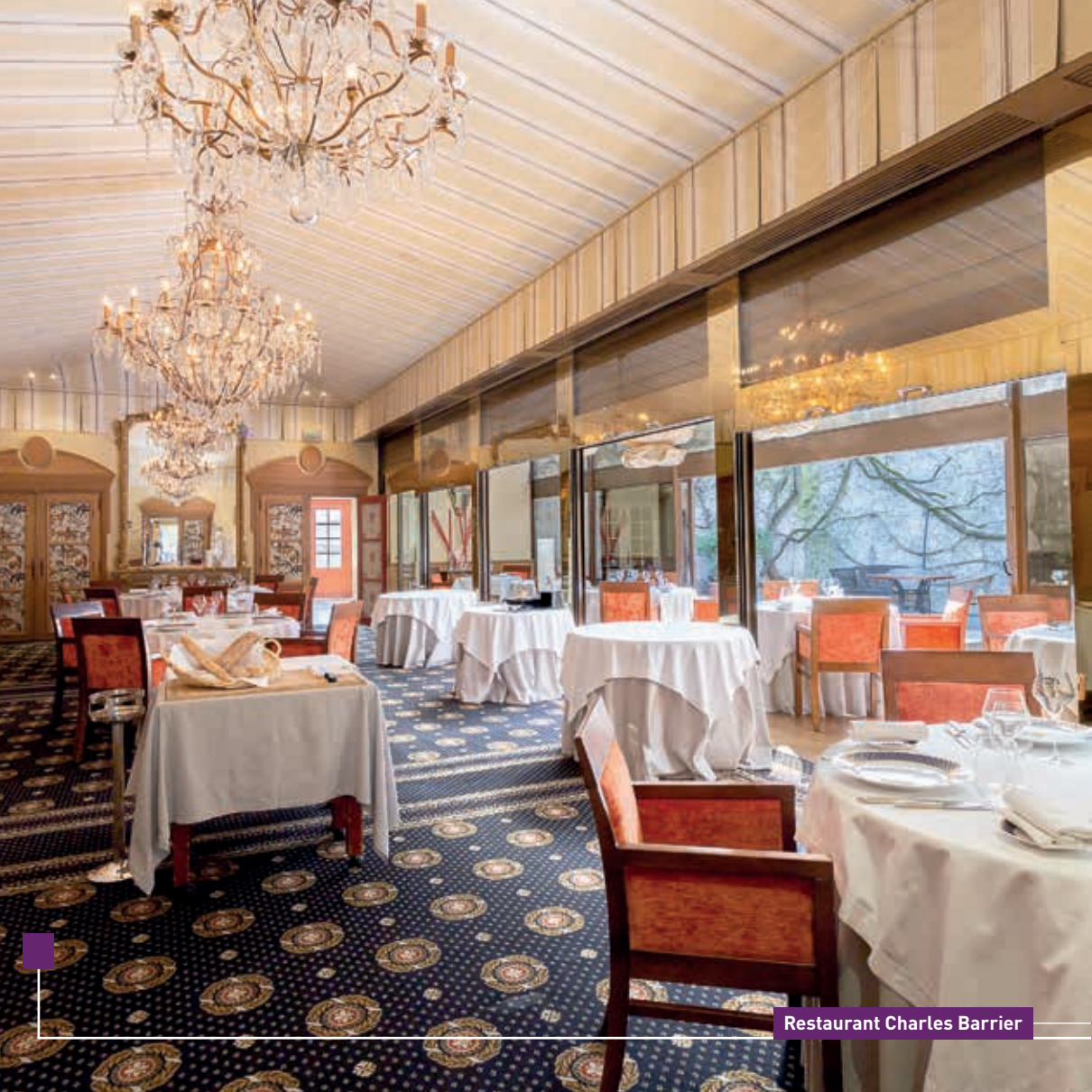
Restaurant Charles Barrier