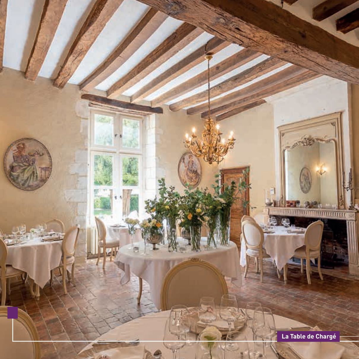
La Table de Chargé