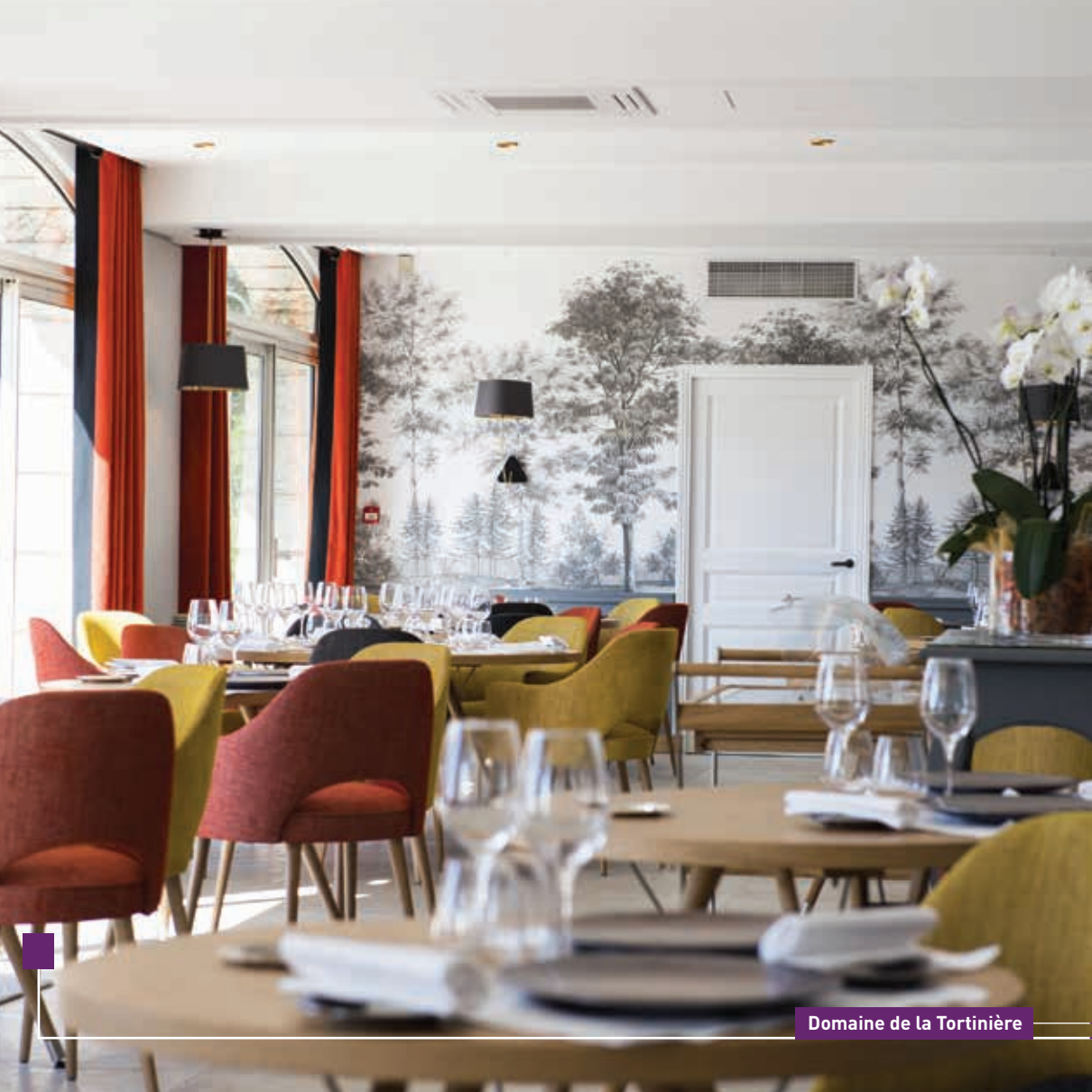
Domaine de la Tortinière