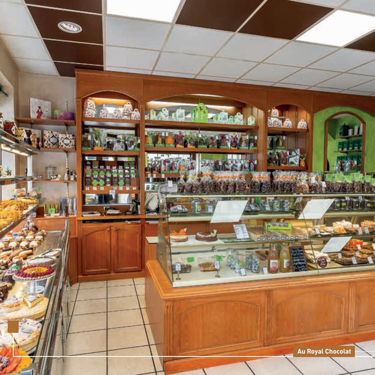
Au Royal Chocolat