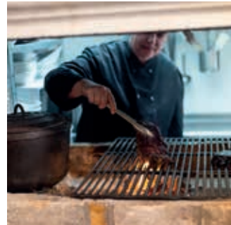
Viande cuite à la cheminée