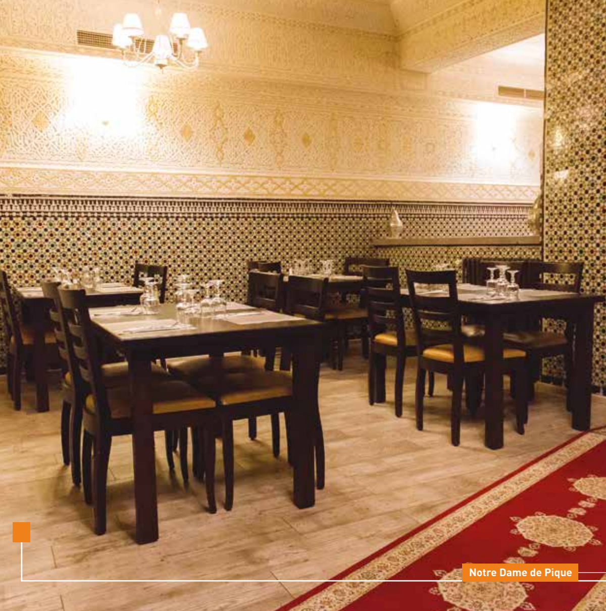
Notre Dame de Pique