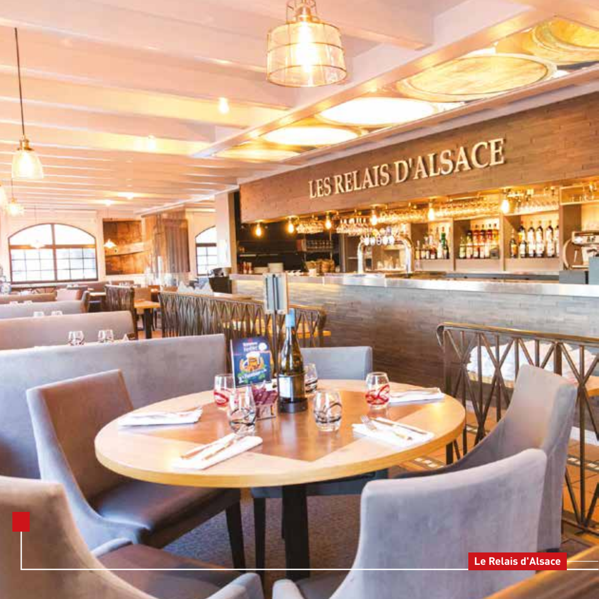
Le Relais d'Alsace