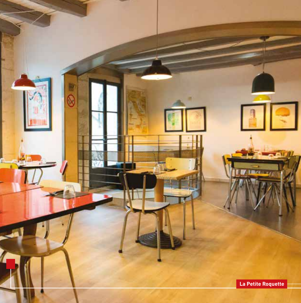
La Petite Roquette