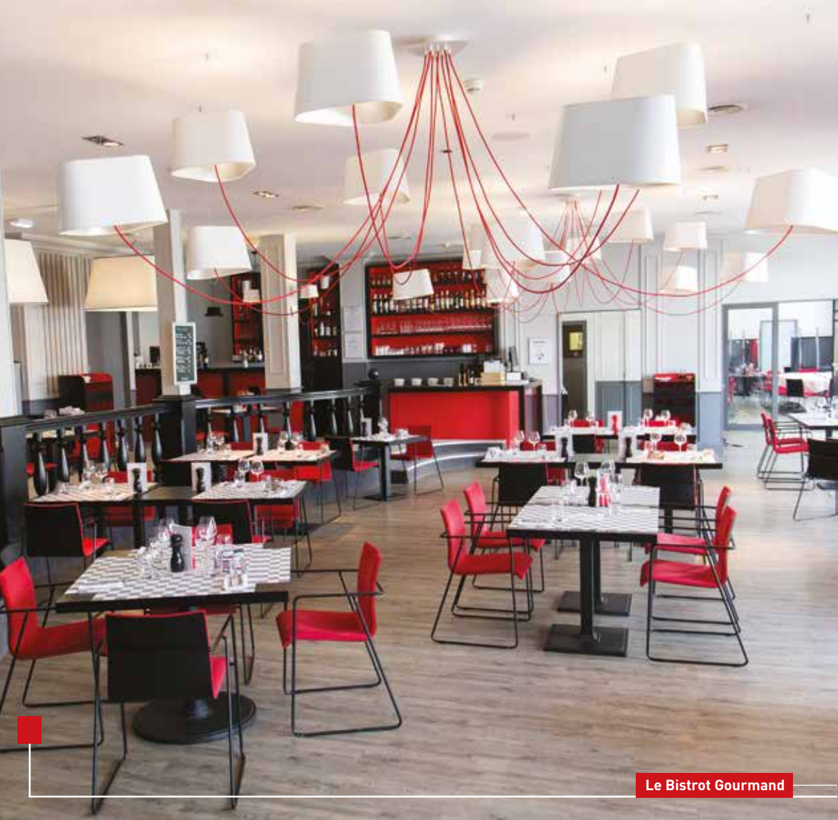
Le Bistrot Gourmand