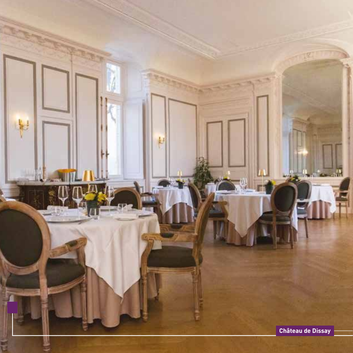
Château de Dissay