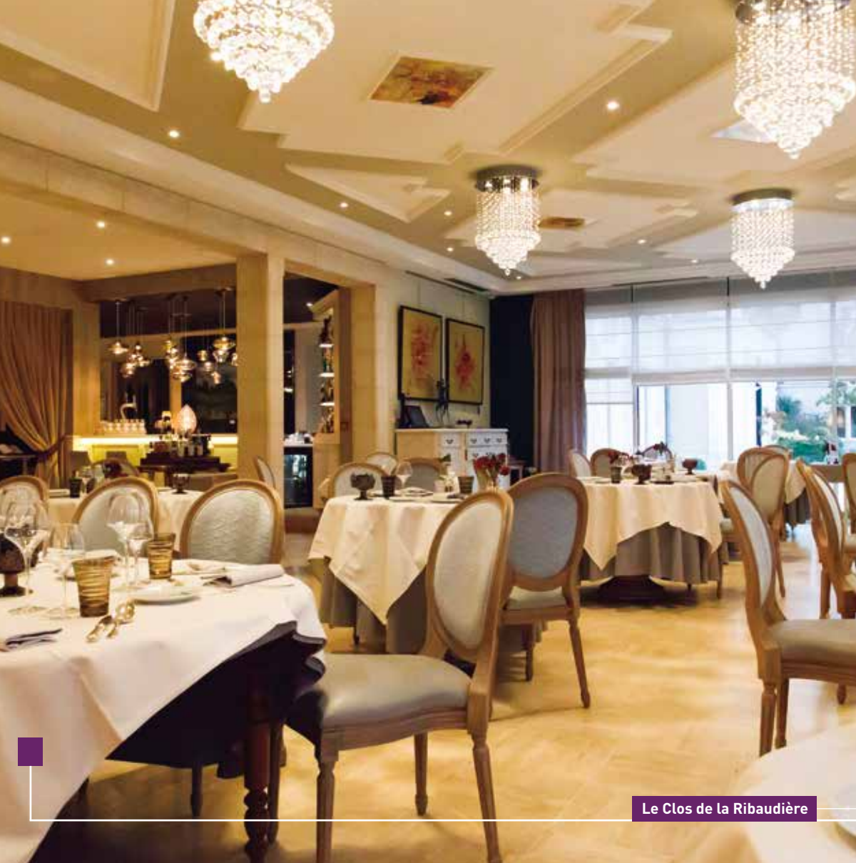
Le Clos de la Ribaudière