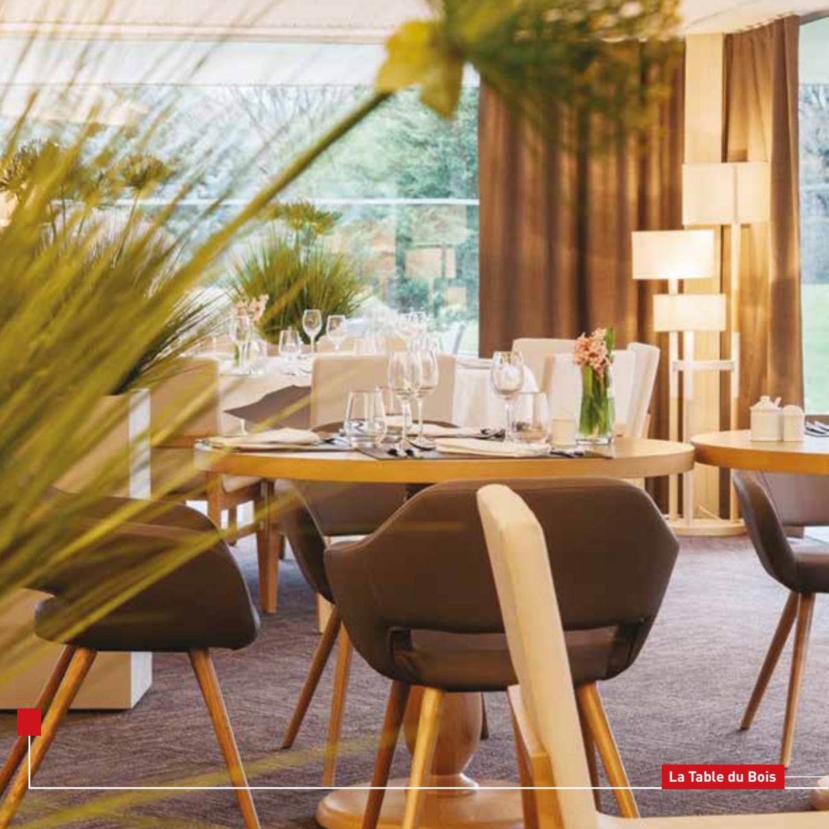
La Table du Bois