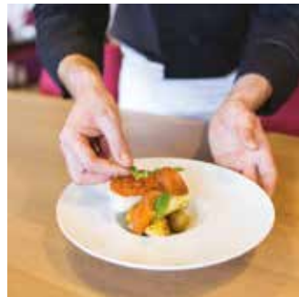
Plat réalisé par Morgan Lappartient