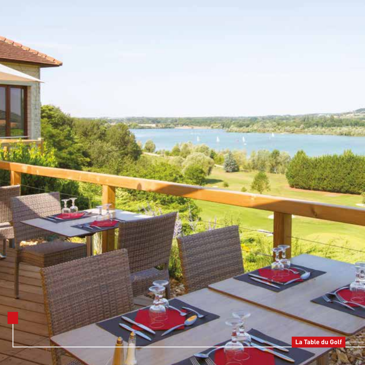
La Table du Golf