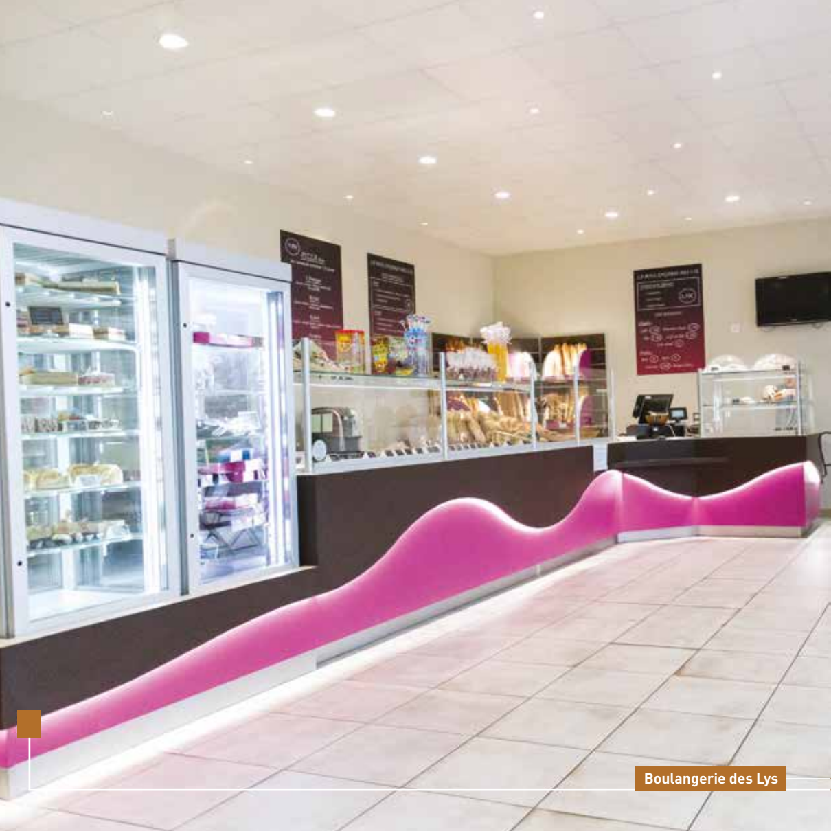
Boulangerie des Lys