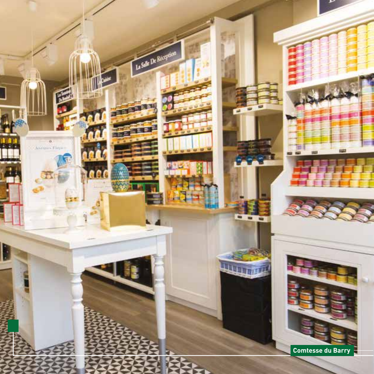
Comtesse du Barry