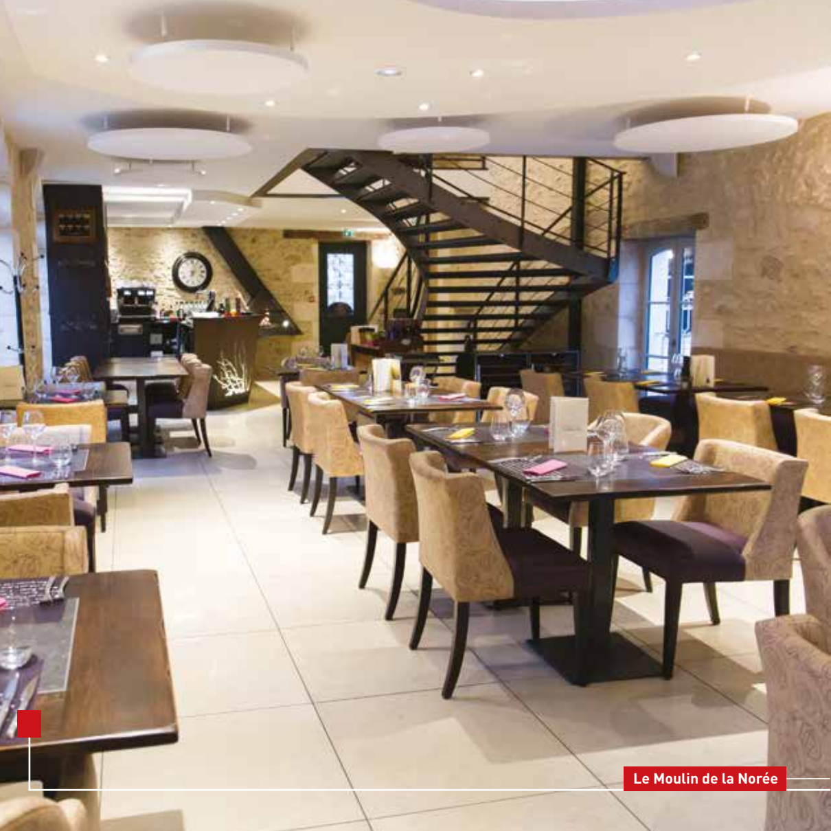
Le Moulin de la Norée