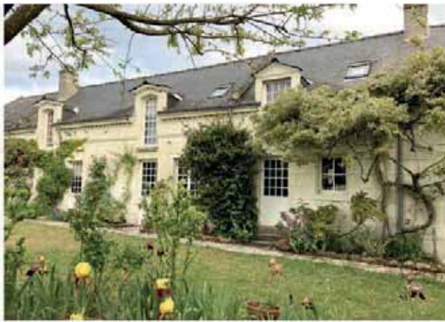
🍀 À la lisière de la cité médiévale de Chinon, dans un jardin avec vue sur la Loire, une chaleureuse demeure en pierre de tuffeau Ref 877149 Vente en exclusivité - 400 000 €