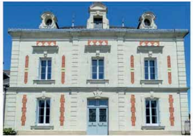
🏠 Dans la campagne du Véron entre Saumur et Chinon, un ensemble immobilier d'environ 700 m 2 à réhabiliter et son vaste jardin Ref 969322 Vente en exclusivité - 400 000 €