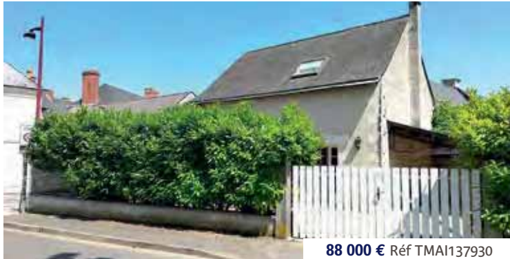
88 000 € Réf TMAI137930

VERNANTES - EXCLUSIVITÉ - Vous serez séduits par le caractère de cette maison de village en tuffeau offrant sur environ 65 m 2 et 2 niveaux : une cuisine, un séjour et 2 chambres. Le tout sur un terrain de 417 m 2 clos de murs. Toutefois, quelques travaux de rénovation seront à prévoir pour en profiter pleinement. DPE : F.