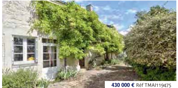
430 000 € Réf TMAI119475

VERNANTES - EXCLUSIVITÉ - Vous serez séduits par le caractère de cette maison de village en tuffeau offrant sur environ 65 m 2 et 2 niveaux : une cuisine, un séjour et 2 chambres. Le tout sur un terrain de 417 m 2 clos de murs. Toutefois, quelques travaux de rénovation seront à prévoir pour en profiter pleinement. DPE : F.