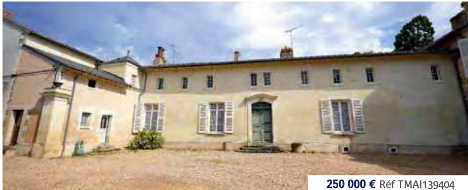
250 000 € Réf TMAI139404

15 MIN DE SAUMUR - SUPERBE PROPRIÉTÉ - Pour les amoureux des maisons de caractère...tuffeau, beaux volumes, poutres, cheminée, 3 chambres...l'ensemble sur environ 260 m 2 habitables. Terrasse ombragée, garage de 50 m 2 , dépendance, caves dans la roche, cour et jardin, l'ensemble du terrain faisant 3340 m 2 sans vis à vis. Idéal pour gîtes. DPE : C.