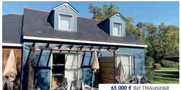
65 000 € Réf TMAI492968

SAUMUR - EXCLUSIVITÉ - SPECIAL INVESTISSEUR - Très bel appartement de 3 pièces, d'environ 80 m 2 , situé au 3 ème et dernier étage d'un petit immeuble. Ce logement est vendu avec un garage et une cave. Il est actuellement occupé par un locataire. Le loyer est de 480 € HC + 35 € de charges locatives. DPE : E.