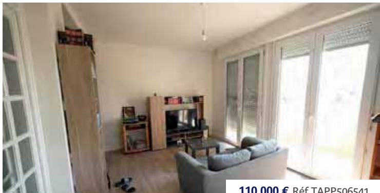
110 000 € Réf TAPP506541

Au coeur de la ville, très bel hôtel particulier du 18 ème siècle. Beaux volumes, cheminées, parquets, tomettes, 5 chambres, vie de plain-pied possible et cave voûtée. Quelques travaux sont toutefois à prévoir pour profiter pleinement du charme et du caractère de cet ancien hôtel particulier. DPE : E.