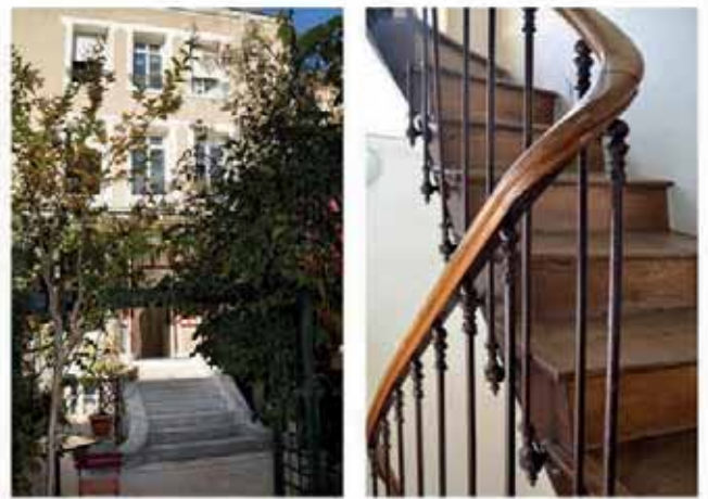
🍀 Au centre de Tours, dans une cour fleurie, un hôtel particulier et une maison à restaurer Ref 992851 1 227 000 €