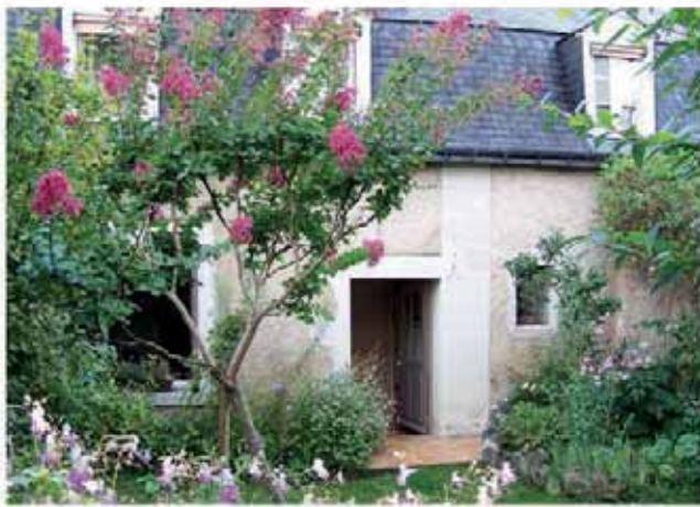
🍀 À Tours, à dix minutes à pied de la gare, une maison comme à la campagne Ref 259875 310 000 €