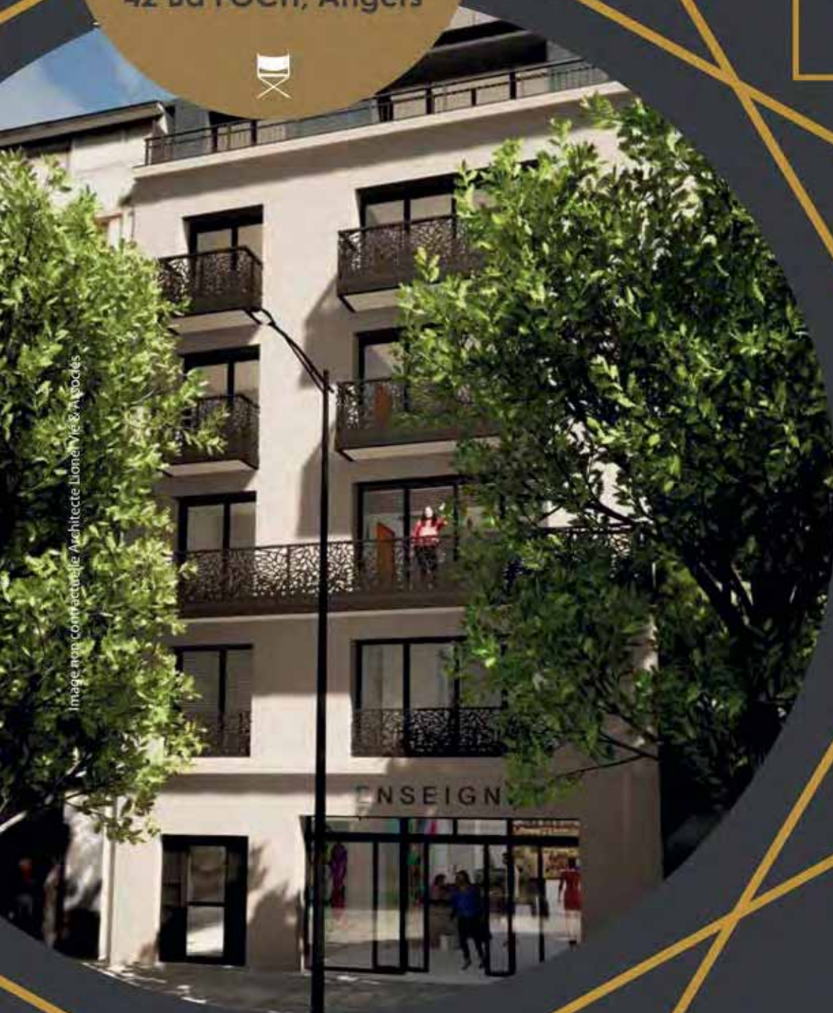
Image non contractuelle. Architecte Lionel Vie & Associés